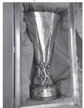
Ezzel a képpel illusztrálták a kupa eltűnéséről szóló hírt

Az Európa-liga idej döntőjét a franciaországi Lyonban rendezik május 16-án.