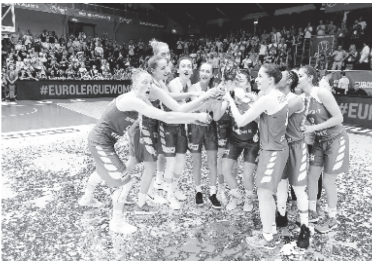
A második helyezett Sopron Basket csapata az eredményhirdetésen.

A 2009-ben negyedik Sopron első magyar csapatként szerzett ezüstérmet az Euroligában, korábban a Pécs kétszer bronzéremmel zárt, egyszer pedig negyedik lett.